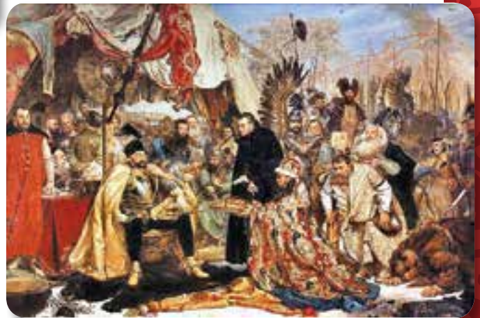
Báthory győzelme az orosz cár fölött

Báthory egy évszázadra feltartóztatta Moszkva előnyomulását. Jobban értette, mire van szüksége Lengyelországnak, mint a korszak lengyeljeinek döntő többsége.