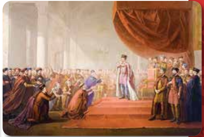
A vilniusi egyetem megalapítása

1579-ben hadjáratot indított Retteggett Iván cár ellen. Nagyszabású terve az volt, hogy meghódítja a Moszkvai Nagyfejedelemséget, majd megszerzi a magyar koronát, s ezzel megvalósítja a lengyel-magyar-erdélyi államszövetséget. Nagy keresztes hadjáratot tervezett a törökök ellen. A pápa támogatását kérte, de csak az áldását kapta meg. A lengyel rendek sem voltak hajlandók a túl nagy vér- és pénzáldozatra, így jelentős győzelmek után, 1582-ben békét kötött a cárral.