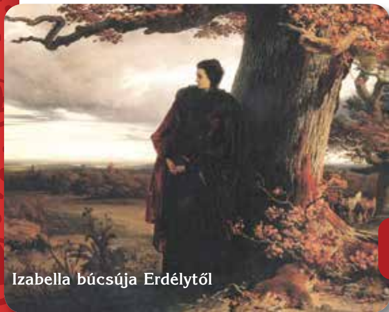
Izabella búcsúja Erdélytől

Lemondatta, és Lengyelországba száműzte Izabellát és a gyermekkirályt, Erdélyt és a koronát pedig átadta a Habsburg császárnak. „Hálából” Ferdinánd kegyetlenül meggyilkoltatta, mert úgy hírlett, hogy török bérenc.