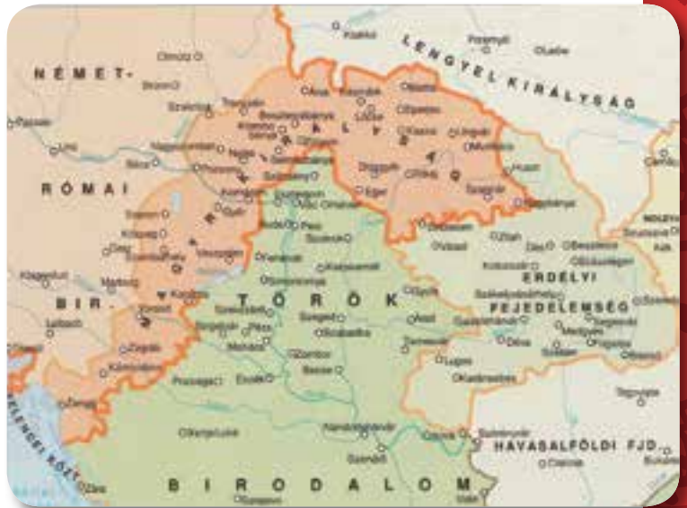
A három részre szakadt ország

Nyaktörő feladat volt a harmadország, a Keleti Magyar Királyság kormányzása a szultán és a császár szorításában. Legjobb lett volna mindkettőtől megszabadulni, de kinek volt erre ereje az akkori Európában?! A Habsburgokkal kötött szövetség keresztény összefogást jelentett volna a török ellen, és a két meg nem szállt ország rész egyesítését. A szultán pártfogása segítette volna Erdély önálló fejlődését, de elszakította volna Nyugat-Magyarországtól. II. János az előbbit választotta. Az 1570-es speyeri szerződésben lemondott királyi címéről a Ferdinánd után trónra lépett Habsburg Miksa javára, és elfogadta, hogy János Zsigmond néven Erdély és a Partium fejedelme legyen. Országát a Magyar Királyság része lett volna, maga pedig a király alattvalója. A szerződés azonban János Zsigmond váratlan (és merénylet-gyanús) halála miatt nem lépett életbe.