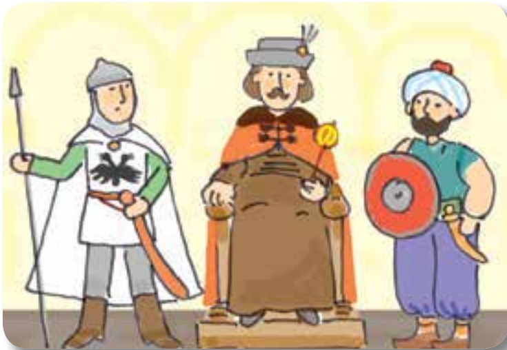
Erdély címere és fejedelmei

Az Erdélyi Fejedelemség viszont létrejött, s bár adót fizetett a szultánnak, és figyelt a császár szavára is, önálló, egyre erősödő kis állammá vált. Első fejedelme János Zsigmond volt. Őt Báthory István követte a fejedelmi székben, aki részben visszaszerezte azt, amiről János Zsigmond kényszerűségből és bölcs megfontolásból lemondott: a királyi címet. Igaz, nem magyar, hanem lengyel királlyá koronázták.