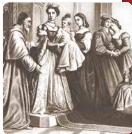
A csecsemő II. János király, Izabella és Fráter György

1541-et írtak ekkor. Az ország három részre szakadt: nyugaton Habsburg uralom, középen török megszállás, keleten a Keleti Magyar Királyság, amelyet a kiskorú II. János helyett anyja, Izabella királyné és Martinuzzi (Fráter György, György barát) kormányzott. A szultán jelképesen fiává fogadta II. Jánost, és vállalta, hogy nagykorúságáig „megőrzi” neki Buda várát. Addig viszont kitessékelte onnan egész udvartartásával együtt.