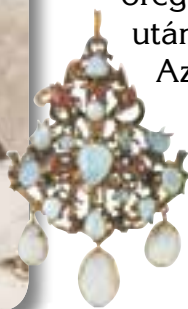
A királyné opálos násfája

Egy évtizedig tartó csatározásuk rengeteg magyar vérbe került, de 1538-ban Váradon végre titkos békét kötöttek. Ferdinánd a nyugati, János a keleti országrész ura lett. Az öreg és gyermektelen János elfogadta, hogy halála után az egész ország Habsburg Ferdinándra szálljon. Az egyezséget mindketten azonnal megszegték. Ferdinánd elárulta a szultánnak a titkos paktumot, Szapolyai pedig feleségül vette Jagelló Izabella lengyel hercegnőt, és 1540-re már meg is született a kis trónörökös, János Zsigmond.