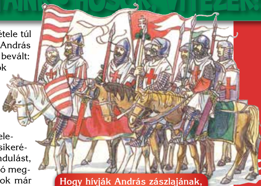
Hogy hívják András zászlajának, pajzsának mintázatát?

Fiúk, győztes csatáink sorába büszkén jegyezhetitek fel András németek fölött aratott két diadalát is. 1230-ban elhunyt