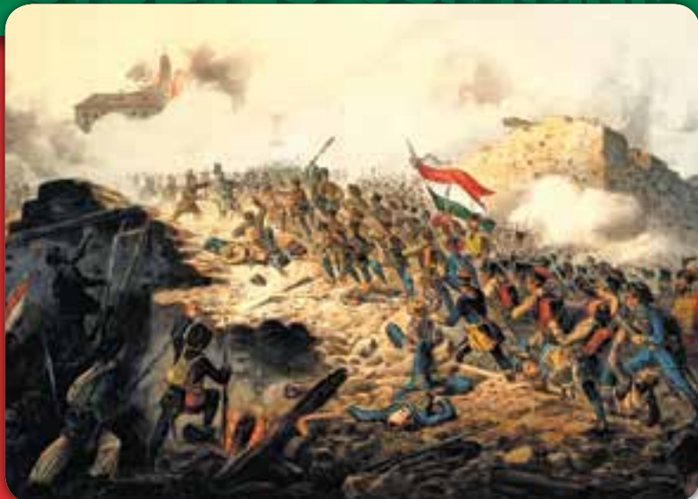
Buda ostroma 1849 májusában

a dombról figyelte. Elámult erején és hősiességén, hát parancsot adott, hogy élve fogják el. Orosz dzsidások rohantak rá, sebesült lova ágaskodva, rúgva, harapva védte gazdáját. Amikor kardja eltört, egy orosz tiszt franciául kérte: Add meg magad, bajtárs! De Zeyk így kiáltott: Zeyk Domokos meghal, de rab nem lesz soha! Előrántotta pisztolyát, egyik golyóval leterített egy kozákot, a másikkal főbelötte magát. Lovával együtt zuhant a véráztatta földre.