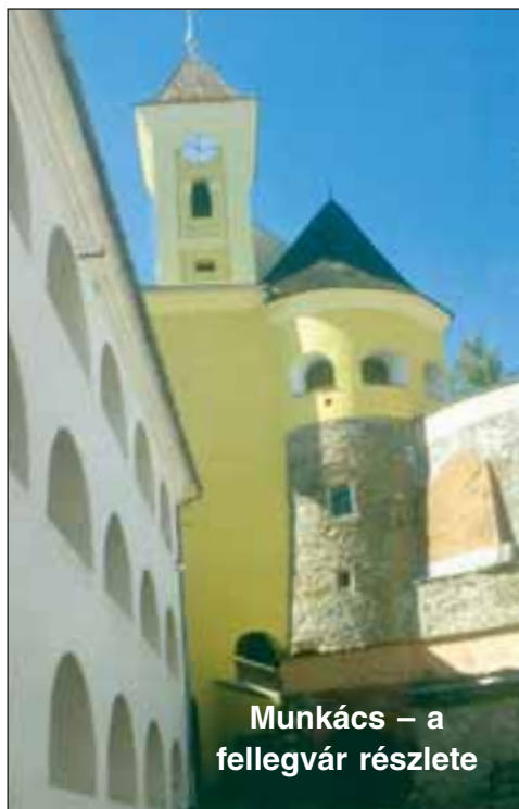
Munkács – a fellegvár részlete