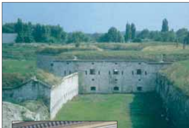
Komárom – várrészlet

Rév-Komárom vára a legjobban védhető erődítményünk volt. A várfalak hossza 14 kilométer. Ide ellenség a lábát erőszakkal soha be nem tette. Az 1848-as szabadságharcban Klapka György tábornok védte hősiesen.