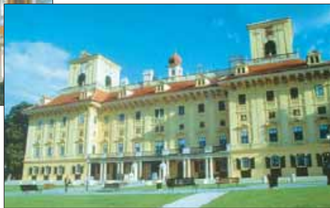
A kismartoni kastély homlokzata

Az Esterházy család házimuzsikusa nem kisebb zeneszerző volt, mint Haydn . Sok halhatatlan műve született Kismartonban (Eisenstadt) és Fertődön, a térség legszebb kastélyaiban. Egyiknek érdekes története van. A herceg nem engedte szabadságra zenészeit. Ekkor írta Haydn a Búcsú szimfóniát , amelyben a zenekar tagjai szólamuk befejeztével rendre elfújták a kottatartójukon égő gyertyát, és elhagyták a termet. Végül csak a mester maradt, akinek néma meghajlását Esterházy elismerő tapssal és persze a megérdemelt pihenést engedélyezve fogadta. A kastélyban ma is csipkefodros, selyem mentében muzsikál a zenekar.