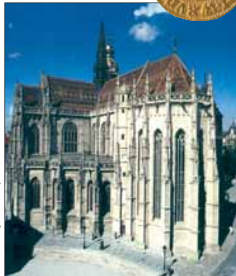
A kassai dóm

Kelet-Szlovákia legnagyobb városa, Kassa a XV. században Buda után a legjelentősebb magyar királyi város volt. 150 évig az erdélyi fejedelmek kezén volt. Mátyás király, Bocskai István, Bethlen Gábor udvart tartott a gazdag kereskedővárosban. Negyedmillió lakosából ma csupán 10.000 a magyar.