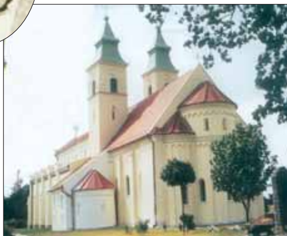
Az 1000 éves deáki templom

A deáki bencés kolostor 1228-ban írt latin nyelvű szertartáskönyvében találták meg az első összefüggő, magyar nyelvű, írott szöveget, a Halotti beszéd és könyörgést .