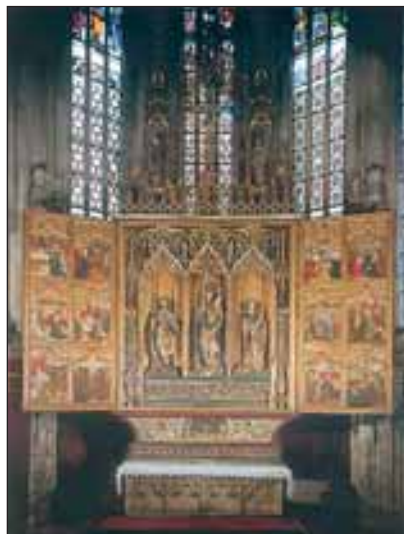
A kassai dóm főoltára

A város ékessége a fő utcán keresztben álló Szent Erzsébet székesegyház vagy kassai dóm . A hatalmas csarnoktemplom a magyar gótikus templomépítés legszebb terméke. Szobrokkal ékes, díszesen faragott kapui, kőcsipkái, fából faragott, festett oltárai bibliai jeleneteket és Árpád-házi Szent Erzsébet életét ábrázolják. A templom alatti kripta nemzeti zarándokhely: itt nyugszik II. Rákóczi Ferenc , akinek hamvait a törökországi Rodostóból 1906-ban hozták haza. A fejedelem mellett a kriptában talált végső nyughelyet anyja, Zrínyi Ilona , fia, József és bujdosótársa, Bercsényi Miklós is.