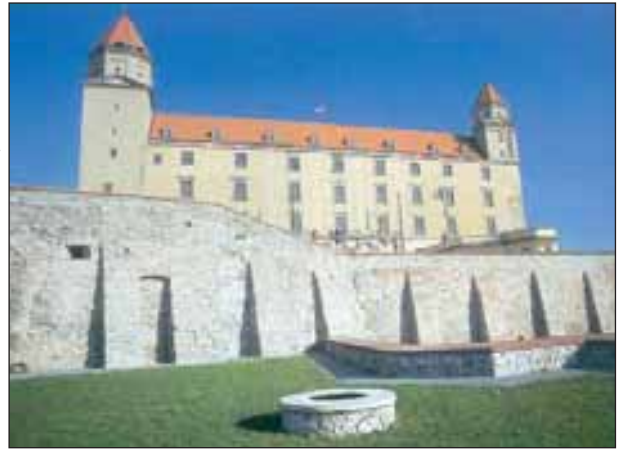
A pozsonyi vár

Szlovákia 1000 évig a magyar állam szerves része volt. Számptalan regélő vár, történelmi hangulatú város mesél a régi magyar dicsőségről. Maga a főváros, Bratislava nem más, mint Pozsony , magyar koronázó város, történelmi jelentőségű országgyűlések székhelye. 4 tornyú vára Mátyás király uralkodása alatt kapta mai alakját. Buda török kézre kerülése után, 1541-től 1784-ig Magyarország fővárosa volt.