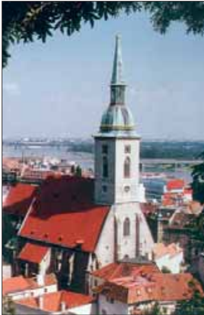
A Szent Márton székesegyház

A magyar királyokat 270 éven át itt koronázták. Erre emlékeztet a Szent Márton székesegyház 85 méter magas tornyán a 300 kg-os aranyozott korona. Pozsony ma a felvidéki magyarság központja.