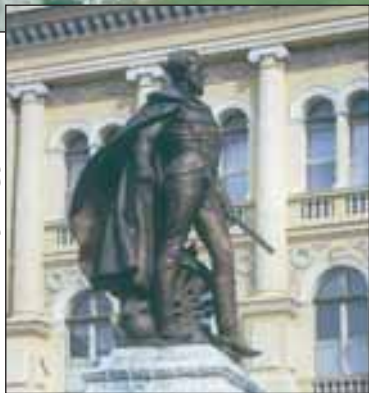
Klapka György szobra

Híres Komárom be van véve, Klapka György a fővezére, Büszkén kiáll a csatátérre, Büszkén kiáltja, huszárok, előre!