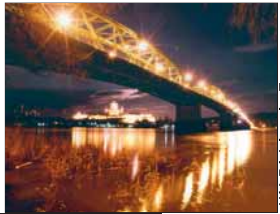
Híd Párkány és Esztergom között

Itt a Duna országhatár. Párkány Szlovákiáé, Esztergom Magyarországé. Közük a híd 50 éven át kettőbe törve zárta el egymástól a két partot. Ma újjáépítve fénylik, és kapcsol össze ismét.