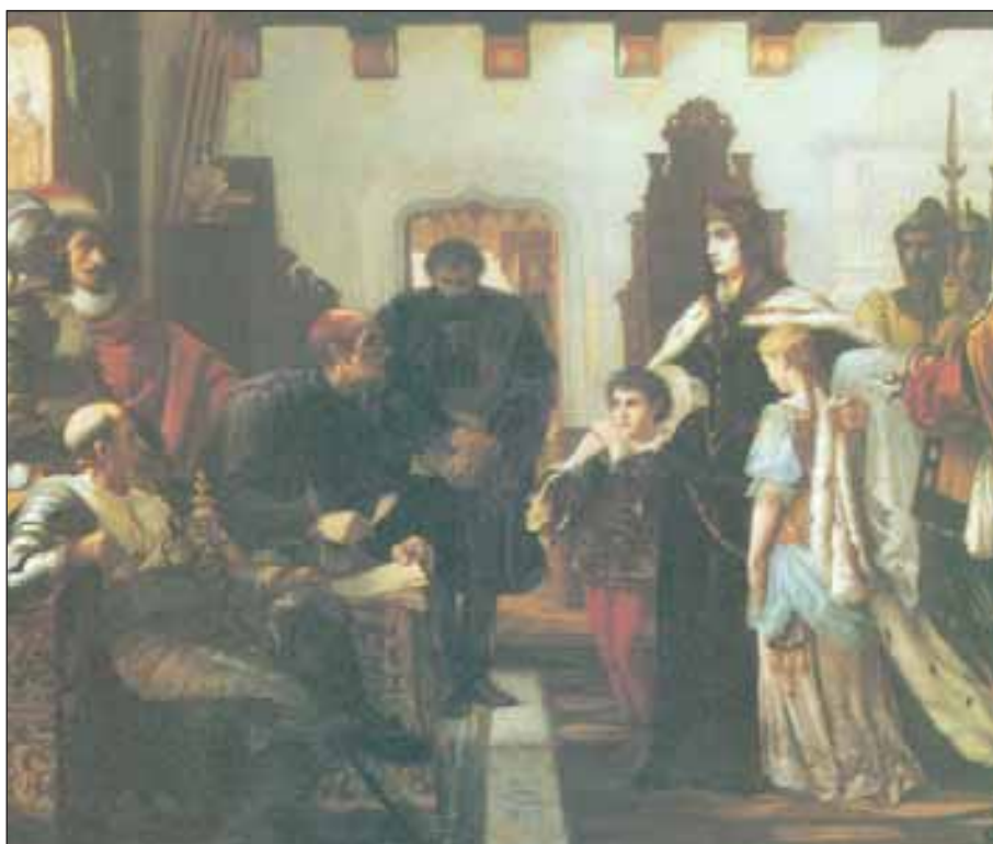
Zrínyi Ilona vizsgálóbírói előtt. Madarász Viktor festménye