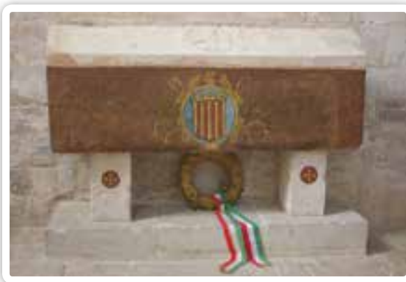
Árpád-házi Jolánta királyné síremléke a vallbonai kolostorban