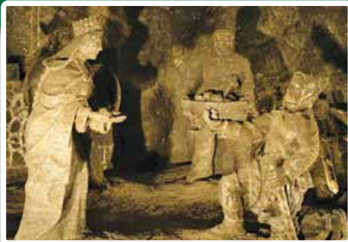
A gyűrű-legenda sóból kifaragva a wieliczki sóbányában

megtalálták, Wieliczkában nyílt meg az első lengyel sóbánya. Ennek mélyén sókápolnában sószobor örökíti meg a történetet.