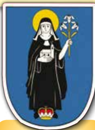
Szent Kinga Stary Sącz (Ószandec) címerében

1939-ben, amikor a német és az orosz csapatok lerohanták Lengyelországot, a magyar kormány nem volt hajlandó részt venni a támadásban, sőt tízezerrel fogadta